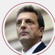
Sergio Massa Ministro de Economía de la Nación Argentina