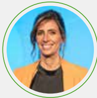
Luciana Geuna Periodista de TN y Canal 13